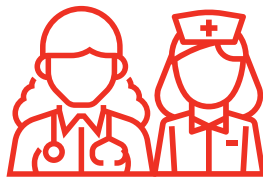
Dokter dan Perawat Pribadi