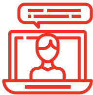
Layanan Jarak Jauh secara Digital

Silahkan hubungi +62-2150858850, aiaindonesia-cs@medix-asia.com untuk info lebih lanjut.