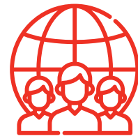
Lebih dari 4,000 Spesialis Terkemuka

Untuk melayani customer AIA, Medix menyediakan hotline untuk pertanyaan tentang COVID-19: covid19-indonesia@medix-asia.com