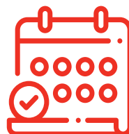
Minimum 3 bulan masa layanan