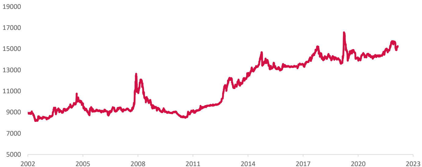
Gambar 3. Pergerakan Nilai Tukar Rupiah Terhadap Dolar AS Sejak Tahun 2002 – Februari 2023

Kinerja masa lalu tidak mencerminkan kinerja masa depan.